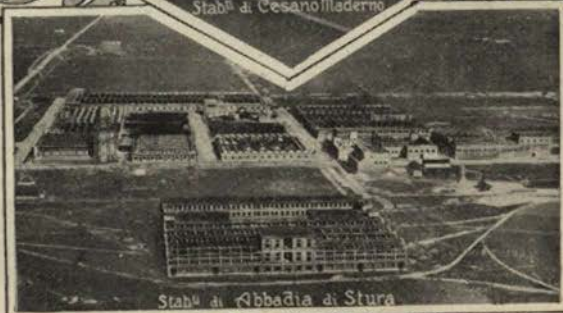
Stabli di Abbazia di Stura