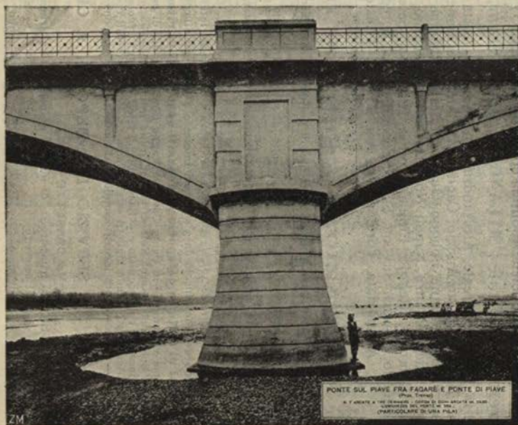
PONTE SUL PIAVE FRA FAGARE E PONTE DI PIAVE A. F. BAROSI & C. ING. ARCHIT. - TORINO - VIA S. GIUSEPPE 10 RAPPRESENTAZIONE DEL PONTE DI PIAVE (PARTICOLARE DI UNA PIENA)