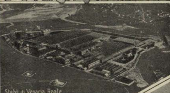
Stabli di Venaria Reale