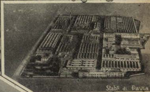
Stabli di Pavia