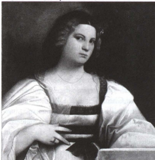
11. Giovanni Cariani, Ritratto di giovane sposa . Museo di Belle Arti, Budapest.

Il pennello assai più aggressivo di Giovanni Cariani celebra, nel ritratto di Budapest (fig. 11), una ragazza d'aspetto deciso che evidentemente non gradisce l'idea di spogliarsi in immagine, tanto che si presenta vestita di tutto punto contentandosi di un attraente decolleté . In assenza dei segnali del corpo restano segni e simboli caratteristici della sposa promessa: il fiore nei capelli, il laccio d'amore al collo, il velo sulle spalle, l'anello all'anulare della mano destra con l'indice e il medio aperti a forbice sul ventre in direzione di un segnale nuovo, che avevo poco fa supposto in termini di astrazione metaforica e che ora si materializza — la cintura stretta dal fiocco ingombrante.