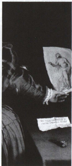
8. Lorenzo Lotto, Ritratto di gentildonna , particolare.

Le Flore di Tiziano e Palma (figg. 5-6) sono appunto floride, mature, consapevoli. Quella di Tiziano denuncia una lieve preoccupazione sul viso stupendamente espressivo e una lievissima difficoltà a scoprire il seno; quella di Palma — che porta un velo tra i capelli e i lacci d'amore al polso sinistro — appare più tranquilla nell'offerta dello sguardo e del corpo. Tutte e due portano alla mano col mazzolino l'anello della promessa, celato/evidenziato in mezzo alle foglie e ai fiori. Tutte e due fanno con la mano sinistra l'identico gesto, più in risalto in Tiziano sul sontuoso broccato di vermiglio e d'oro, un tantino attenuato in Palma dall'ingombro del panno verde: dirigono verso il ventre l'indice e il medio aperti a forbice. Si tratta di un gesto retorico di indicazione, e l'indicazione del ventre alle soglie del matrimonio non richiede certo ulteriori delucidazioni. Ma farò ancora (e pur senza po-