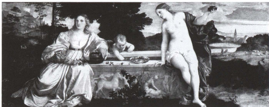
14. Tiziano, Amor sacro e amor profano . Galleria Borghese, Roma.