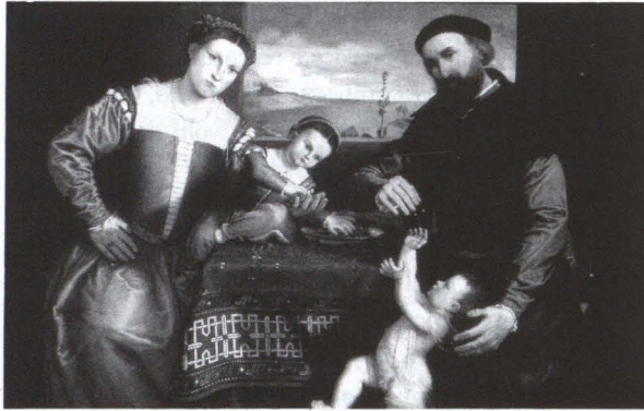
20. Lorenzo Lotto, Ritratto di Giovanni della Volta con la sua famiglia . National Gallery, Londra.

rappresentata dal ricco interno “borghese”, dove i coniugi hanno indossato gli abiti migliori prima di sedersi al tavolo coperto dal lussuoso e onorifico tappeto. I gesti dell'uomo compongono una vera e propria impresa , dove il motto