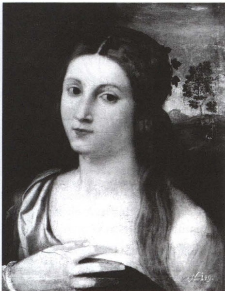
12. Jacopo Palma il Vecchio, Ritratto di giovane sposa . Museo di Belle Arti, Budapest.

mente florido sotto gli abiti di straordinaria ricchezza sartoriale (e coloristica) — tiene a sua volta nella mano sinistra una scatola piena di nastri multicolori da cui esce, scendendo sul parapetto, una sottile catenina d'oro, o forse (che fa lo stesso) ancora un nastro, dorato e tessuto in forma di catena. La scatola da cucito è un segnale di particolare importanza. Di varia foggia e di vario pregio, tanto che in un matrimonio d'alto livello può diventare un cesto o una cassetta d'argento, è il dono consegnato alla sposa dal compare d'anello proprio la mattina delle nozze: attributo corrente della Vergine Maria, allude all'intatta purezza della donna; strumento indispensabile delle tradizionali attività femminili, indica il rispetto dei costumi famigliari e il buon governo della casa.