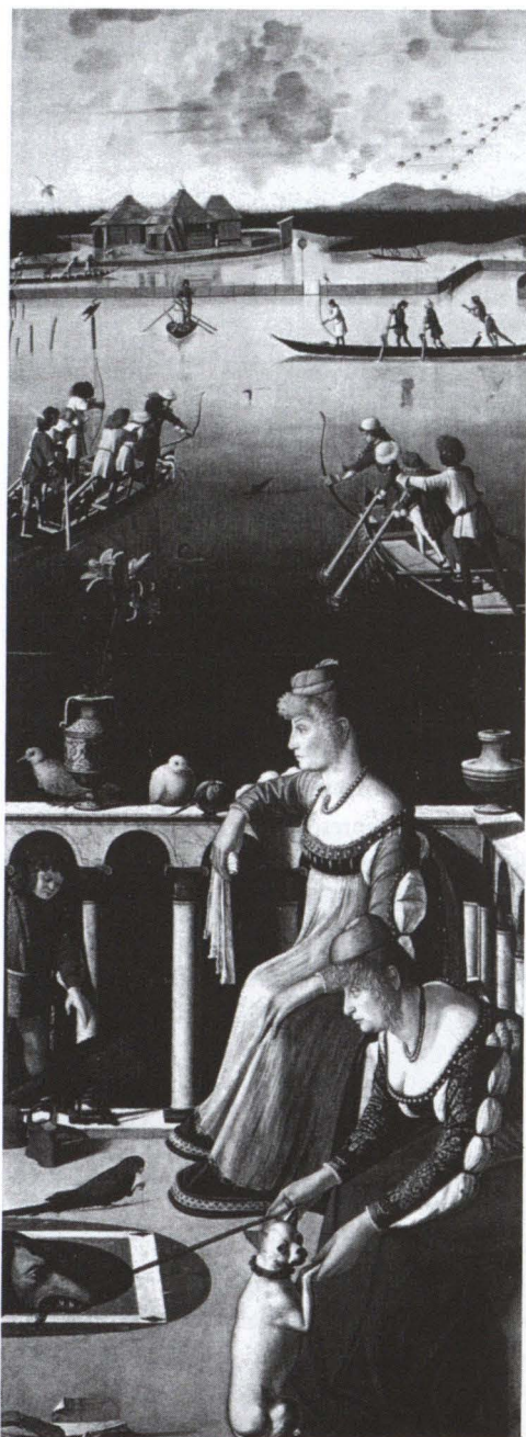
3. Lo sportello ricostituito (montaggio fotografico)

del cane, fedeltà e vigilanza, radicate nel senso comune oltre che in una sterminata tradizione testuale e figurale; e segnala in tal modo — somigliantissima qual è alla più giovane, di cui sarà madre, o magari sorella maggiore — la sua personale funzione di compagna e custode, garante dell'onestà matrimoniale e dell'onore familiare. C'è infine il garzone ben vestito che entra nel balcone: un messaggero che porta notizie dal lontano mondo maschile.