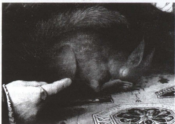
19. Lorenzo Lotto, Ritratto di coniugi , particolare.

in particolare un minaccioso futuro di tempesta, e provvede tempestivamente a fronteggiarlo.