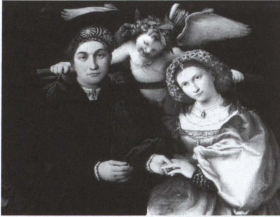
17. Lorenzo Lotto, Ritratto di Marsilio e Faustina Cassotti . Museo del Prado, Madrid.

pisce se è un voyeur o un reggimoccolo); in casi un po' peggiori, starebbe lì come interessato terzo incomodo, subdolo tentatore nell'ombra (e non si capisce chi avrebbe potuto chiamarlo dentro il quadro); nei casi più disperati, si tratterebbe della rivalità tra due uomini infatuati della stessa cor-