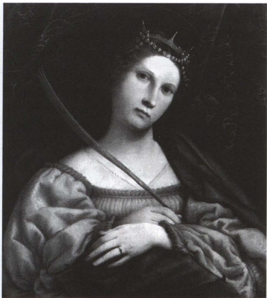
9. Lorenzo Lotto, Ritratto di giovane donna come santa Caterina . National Gallery of Art, Washington.

Oltre ovviamente alle Flore, è passata per prostituta finché la dama di un celebre ritratto di Lorenzo Lotto (figg. 7-8), che pure qualifica le proprie virtù coniugali — e dichiara evidentemente il suo nome — mostrando il disegno con l'onorato suicidio di Lucrezia e il foglio con una frase di Livio in elogio del pudore oltraggiato dell'eroina romana. Per evitare gli equivoci dei posteri ignoranti, una fanciulla per bene non poteva che travestirsi, a cura del Lotto, da santa Caterina (fig. 9) — se si chiamava Caterina.