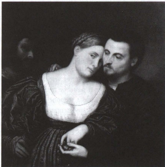
16. Paris Bordon, Gli sposi e il compare d'anello . Pinacoteca di Brera, Milano.

In un dipinto di Paris Bordon, a Brera (fig. 16), un uomo e una donna s'abbracciano, per la verità assai castamente, in presenza d'un altro personaggio maschile. Poiché capita — di rado, e comunque fuori luogo — che il risentito moralismo degli "interpreti" si capovolga in complementare prurigine, di questo dipinto, per via dell'inedito triangolo, si dice di tutto: nei casi migliori, il terzo sarebbe un amico affezionato che assiste alle effusioni degli amanti (ma non si ca-