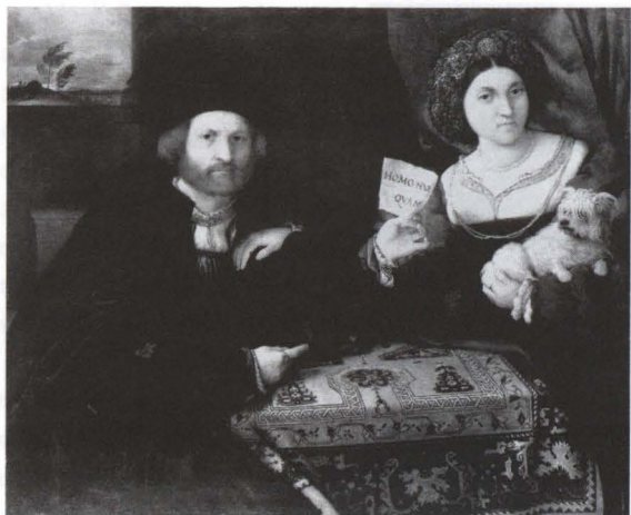
18. Lorenzo Lotto, Ritratto di coniugi . Museo dell'Ermitage, San Pietroburgo.

degli sposi, e ne ha a disposizione, nell'angolo in alto a sinistra, un'ulteriore riserva. Intanto gli sposi insistentemente ci guardano, per chiamarci, insieme al pittore, a testimoni ufficiali dell'evento.