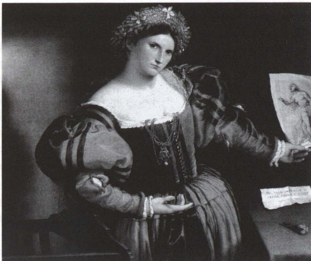
7. Lorenzo Lotto, Ritratto di gentildonna . National Gallery, Londra.

promesse spose sulla soglia tra verginità e conubio: hanno sciolto sulle spalle nude i lunghi capelli, talvolta coperti o attraversati dal velo nuziale, hanno allentato, quasi dismesso il manto, e si presentano con l'immane camicia bianca, "intimo" d'uso corrente, ultimo fragilissimo baluardo che lo sposo sarà chiamato ad abbattere. Si presentano — sempre e soprattutto: anche se