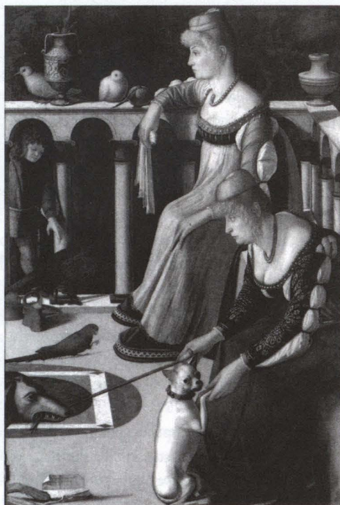
1. Vittore Carpaccio, Due dame veneziane . Museo Civico Correr, Venezia.

La donna più giovane, dallo sguardo malinconico fisso davanti a sé, è sposa promessa o sposa recente: solo in quanto tale può portare perle intorno al collo e perle ancora intorno alla scollatura dell'abito, a segnala-