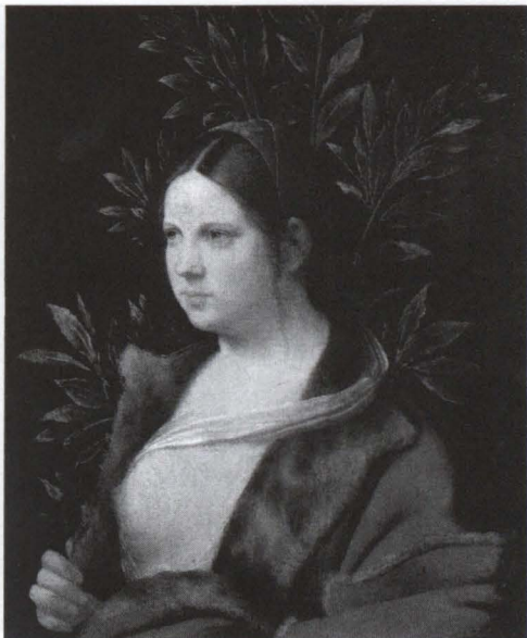
10. Giorgione, Ritratto di giovane sposa ('Laura'). Kunsthistorisches Museum, Gemäldegalerie, Vienna.

Palma ha dipinto un'intera galleria di questi ritratti. La protagonista di quello di Budapest (fig. 12) è una timida giovinetta dallo sguardo dolcissimo e un tantino spaurito, che scopre soltanto un accenno di seno, lascia cadere i lunghi capelli sulla spalla nuda, porta la mano al petto in segno di fedeltà e promette il suo amore per l'eternità con il simbolo inequivoco dell'edera che le cinge il capo. La splendida dama del Museo Thyssen-Bornemisza di Madrid (fig. 13) — priva di anelli o altro ornamento, sguardo di straordinaria intensità nel richiamo amoroso, mano destra ai capelli sciolti, camicia bianca che copre ma evidenzia il seno particolar-