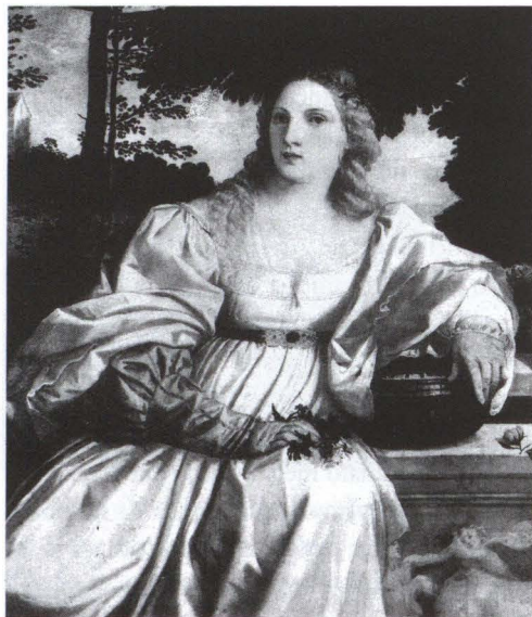
15. Tiziano, Amor sacro e amor profano , particolare.