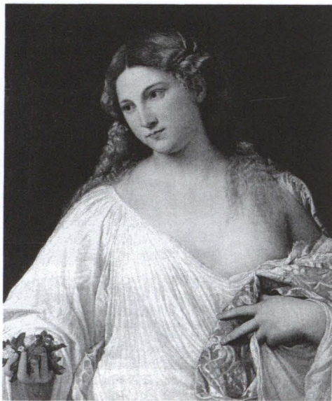
5. Tiziano, Flora . Galleria degli Uffizi, Firenze.

stimento idealizzante: Flora non può essere troppo individualizzata, perchè il ritratto deve lasciare spazio al modello . Si tratterà, naturalmente, di Flora moglie di Zefiro, sinonimo di concordia maritale e di fecondità naturale secondo la tradizione ovidiana ( Fast.