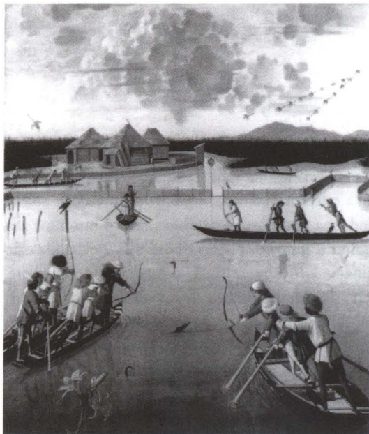
2. Vittore Carpaccio, Caccia in laguna . J. Paul Getty Museum, Los Angeles.

d'amore, pegno lasciato dall'uomo lontano perché ella possa asciugare le lacrime. Siede tra il vaso di mirto o di bosso — anche questi simboli di Maria, di Venere, di matrimonio — e il vaso con lo stemma, che contiene ormai solo la parte inferiore del giglio, un fiore che naturalmente non ha nulla a che fare con la dea dell'amore ma in compenso è il segno di castità ed elezione della sposa del Cantico dei Cantici nonché l'obbligatorio omaggio di Gabriele al momento dell'Annunciazione: insomma, un simbolo chiaro e diffuso della purezza di Maria.