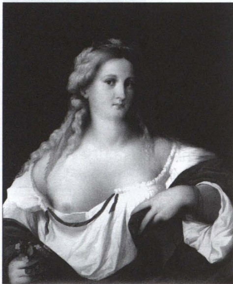
6. Jacopo Palma il Vecchio, Flora . National Gallery, Londra.

considera, non legge, non vede simboli e segni — e lo studio della committenza, poiché propone, implicitamente o esplicitamente, l'allucinante ipotesi che la meretrice o il suo cliente siano interessati alla pittura e spendano nel ritratto i denari di (parecchi) incontri d'alco-va; e dipende — infine, e soprattutto — dall'inveterata attitudine moralistica, bigotta, sessuofobica a dar della puttana a ogni donna che metta in evidenza il suo potenziale di erotismo 2 .