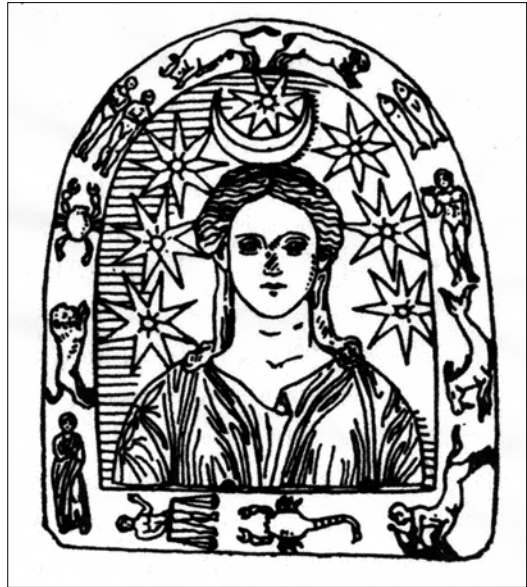
Figure 5. Marble bust of Selene from Argos with hidden magical inscription; drawing after Delatte 1913a

womb of women, Orôriôuth Aubax . Guardian the womb of women, [34 vowels]. Savior the womb of women, Amoun ". 23