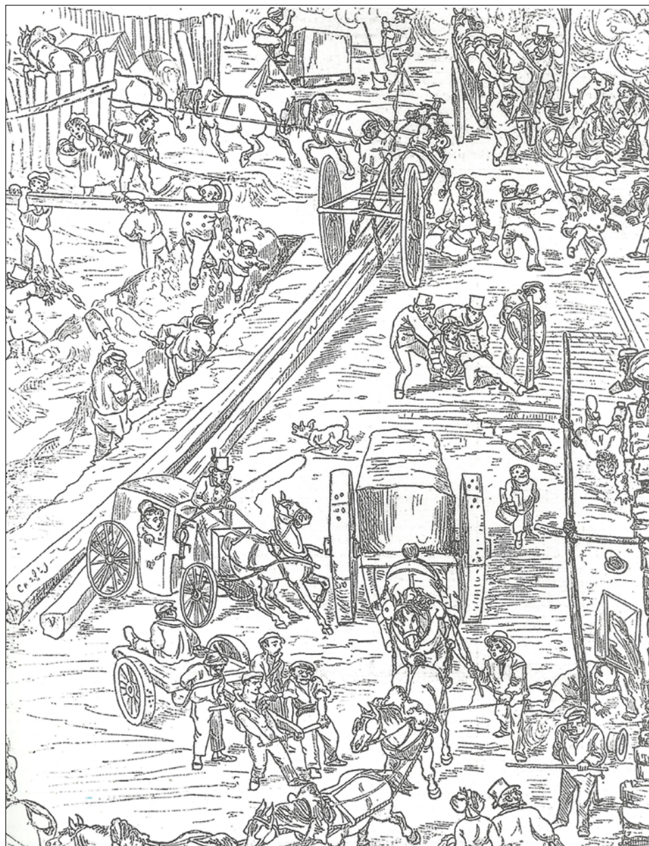
Figura 4. Crafty (seudónimo de Victor-Eugène Geruzez), Les démolitions de Paris , publ. en Le Monde Illustré , 1868