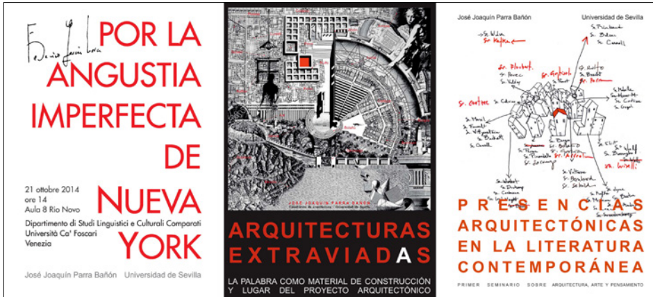
Figura 2. Tres carteles venecianochilenos.

también Gentile Bellini y Sandro Botticelli, optaron por las arquerías y por los pórticos en fuga, por las galerías en las que hay una misteriosa puerta abierta, o una grieta, que más alude a las aberturas del cuerpo que a las de la arquitectura. El ágora era, al fin y al cabo, la casa de citas por excelencia.