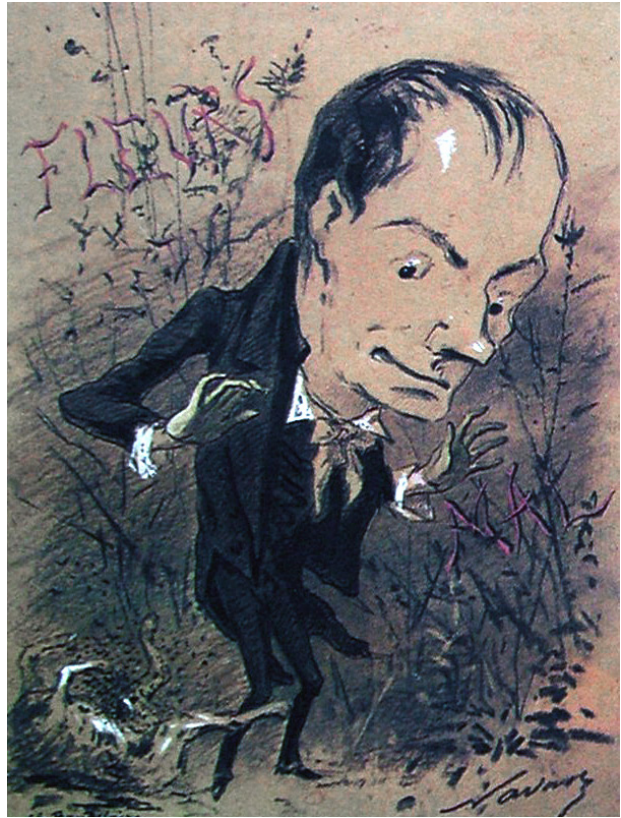
Figura 2. Nadar (seudónimo de Félix Tournachon), caricatura de Charles Baudelaire

Tanto en Les Fleurs du Mal como en los Petits poèmes en prose o en el resto de su revolucionaria obra, Baudelaire hizo de la gran ciudad y sus nuevas dinámicas el eje de su poética y dictaminó para el artista moderno el doloroso deber de abandonar viejas arcadias y de sumergirse en el interior de la urbe y, sobre todo, en el seno de la multitud. El flâneur , que recorre la ciudad de modo aparentemente azaroso pero sabiendo siempre hallar el interés oculto de lo que a otros pasa desapercibido, se convertirá, así, en el trasunto de ese artista-alquimista-químico moderno que convierte el lodo de la ciudad en el oro del arte moderno.