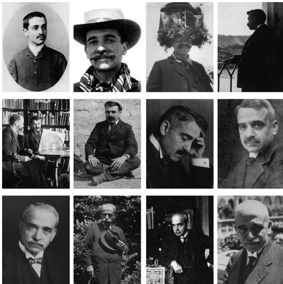
Figura 3. Atlas de retratos de Aby Warburg