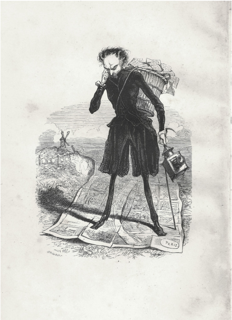
Figura 1. Paul Gavarni (seudónimo de Sulpice Guillaume Chevalier), frontispicio de Le Diable à Paris , 1845