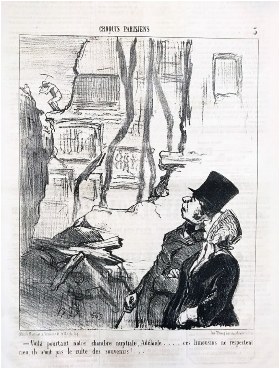
Figura 5. Honoré Daumier, ¡Mira, nuestro dormitorio! , 1853