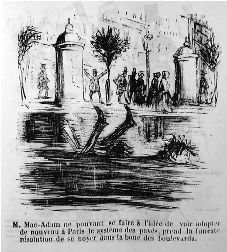
Figura 3. Cham (seudónimo de Amédée de Noé), M. Mac Adam, publ. en Le Charivari , 1852

y muy especialmente de ese género fronterizo que es el «poema en prosa», una forma literaria tan híbrida y compleja como la propia vida de las ciudades, «palabra de cruce» (Barja 1996) caracterizada por una mezcla de sensaciones de muy diverso tipo que los modos literarios y artísticos tradicionales resultan insuficientes para poetizar.