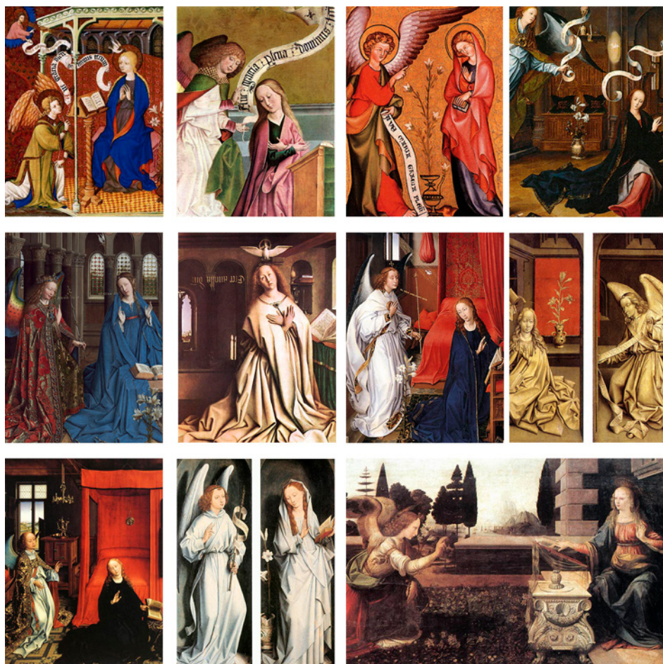
Figura 1. Mosaico de anunciaciones filactéricas