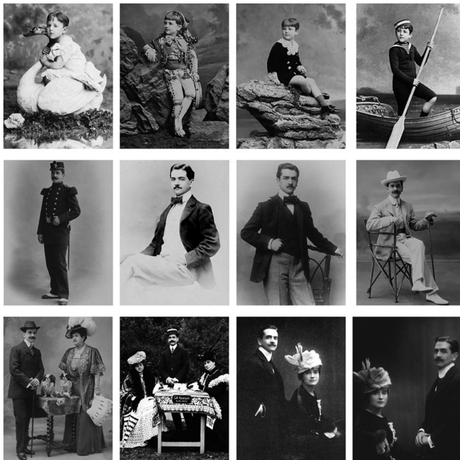
Figura 4. Doce retratos de Raymond Roussel