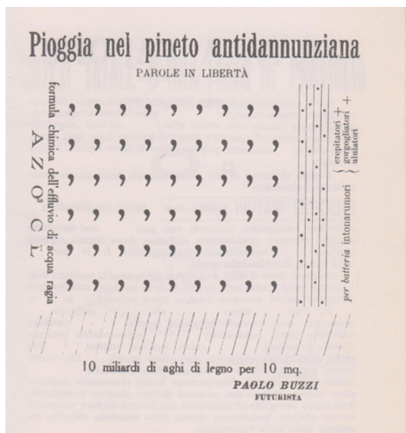
Figura 1. Paolo Buzzi, Pioggia nel pineto antidannunziana. Parole in libertà . 1916. Pubblicata in L'Italia futurista , 1(4), 25 luglio 1916; riprodotta in Papini 1977, 105

Se è altamente improbabile che la pioggia dannunziana abbia varcato l'oceano per ispirare a Charles M. Schulz una curiosa striscia dei Peanuts , datata 1978 (Charlie Brown e Sally camminano sotto la pioggia: «The rain falls on the hills and in the valleys»; «It rains on the cities and on the fields»; «It rains on the just and the unjust»; infine Snoopy, sopra la sua cuccia: «And in my face!»), è invece dichiarata la derivazione antifrastica dalla celebre poesia alcionia di una tavola parolibera di Paolo Buzzi del 1916, intitolata Pioggia nel pineto antidannunziana. Parole in libertà . Sei linee formate ciascuna da nove virgole a stampa (a indicare ovviamente le gocce di pioggia) sono seguite da ventisette tratti obliqui a penna e, in calce e a stampa, dall'indicazione «10 miliardi di aghi di legno per 10 mq». Lungo il bordo sinistro, in verticale: «formula chimica dell'effluvio di acqua ragia / A Z O 3 C L»; lungo il bordo destro, sempre in verticale, un rigo musicale con indicate le note, e in calce: «per batteria intonarumori { crepitatori + gorgogliatori + ululatori». L'indicazione finale allude alla esecuzione della composizione futurista con l'intonarumori ('noise-intoners'), l'innovativo e provocatorio strumento costruito nel 1913 da Luigi Russolo. 6