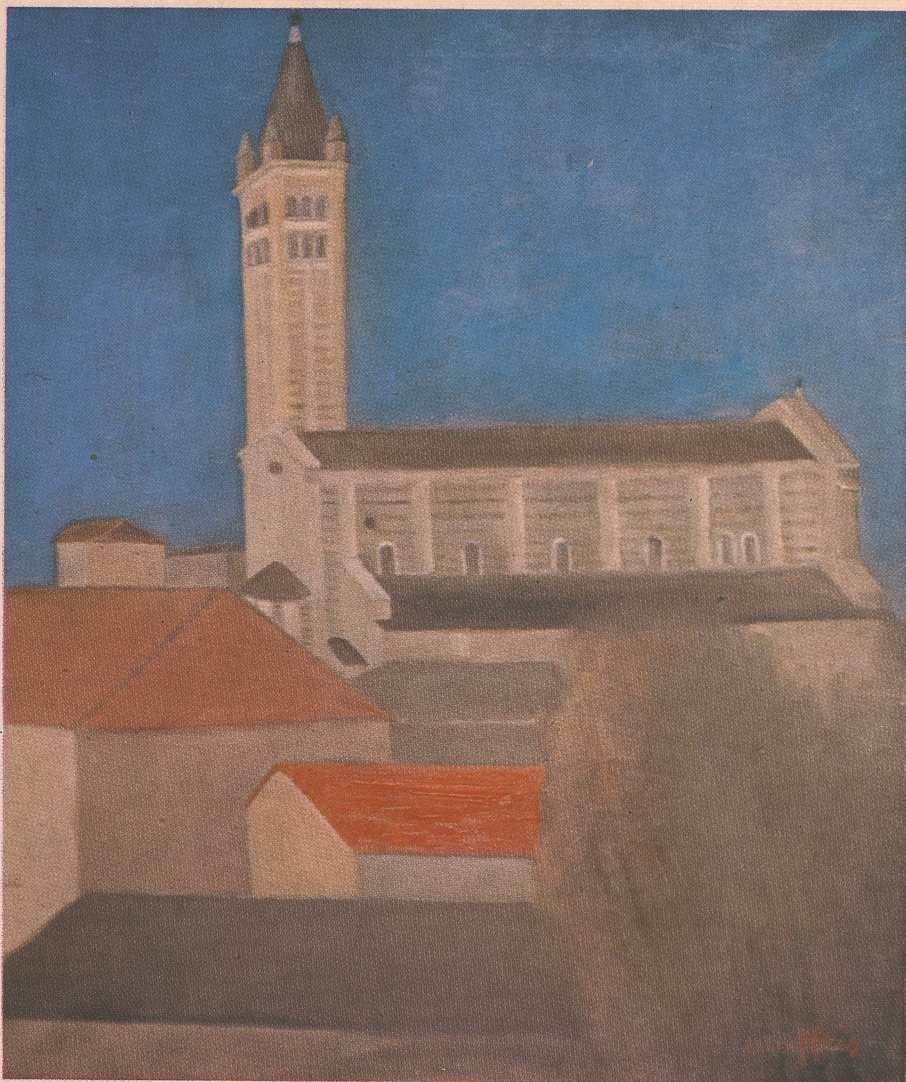
S. Zeno dallo studio (tela 50 x 60)