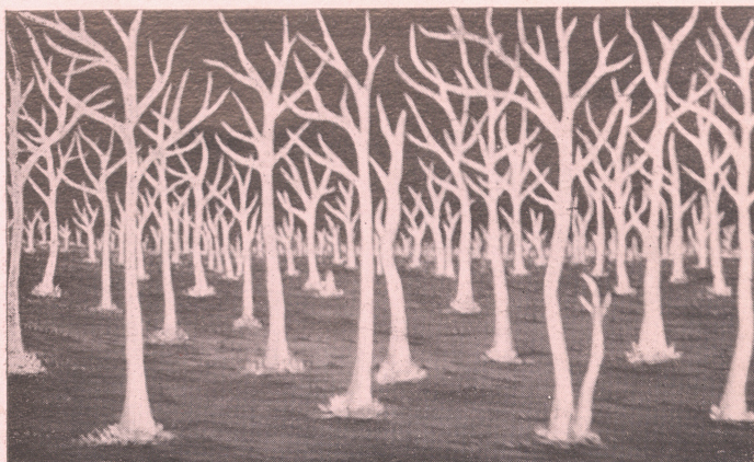
« Alberi bianchi », olio su tela, cm. 50x70, 1966.