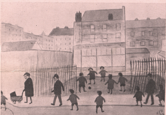
« Cockneydom », acquarello, cm. 20x30, 1964.