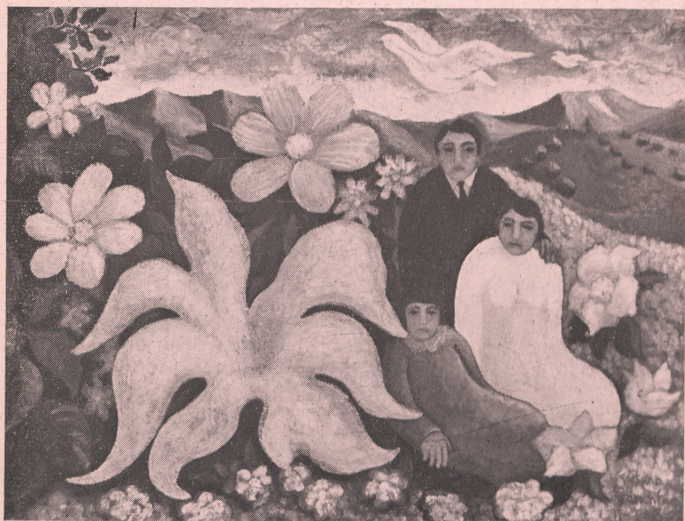
« Primavera », olio su tela, cm. 130x97, 1966.