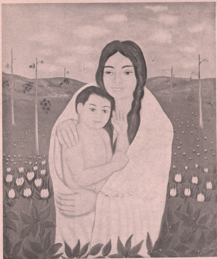
«Madonna Indiana», olio su tela, cm. 100x70, 1966.