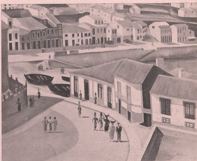
« En Bretagne », olio su tela, cm. 40x55.

MADELEINE LUKA. E' nata a Monsoulmaffieres (Seine ed Oise). Da bambina disegnava i personaggi delle storie che la sua stessa immaginazione creava. Non ha mai studiato arte. Incominciò ad esporre nel 1919 al Salon d'Automne, al Salon des Tuileries e dal 1938 al Salon de la Nationale. Ha esposto a Tokio, Bruxelles, Berlino, Londra e all'Istituto Carnegie in America.