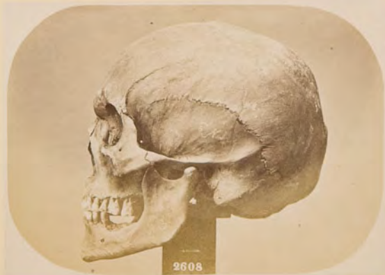
Cranio lappone, di Kautokeino ♂, N. 2608