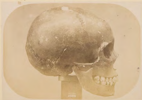
Cranio lappone ♀, di Macè, N. 2598