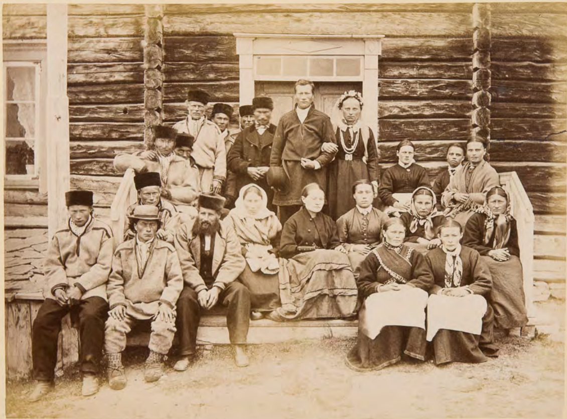
Matrimonio lappone a Bossekop (Altenfjord)