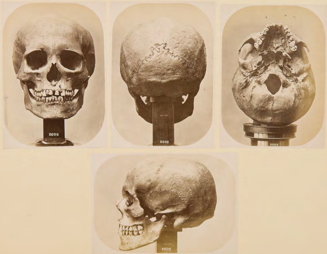
Cranio lapone di Kautokeino ♂, N. 2602