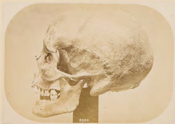
Cranio lappone ♀, di Kautokeino, N. 2606