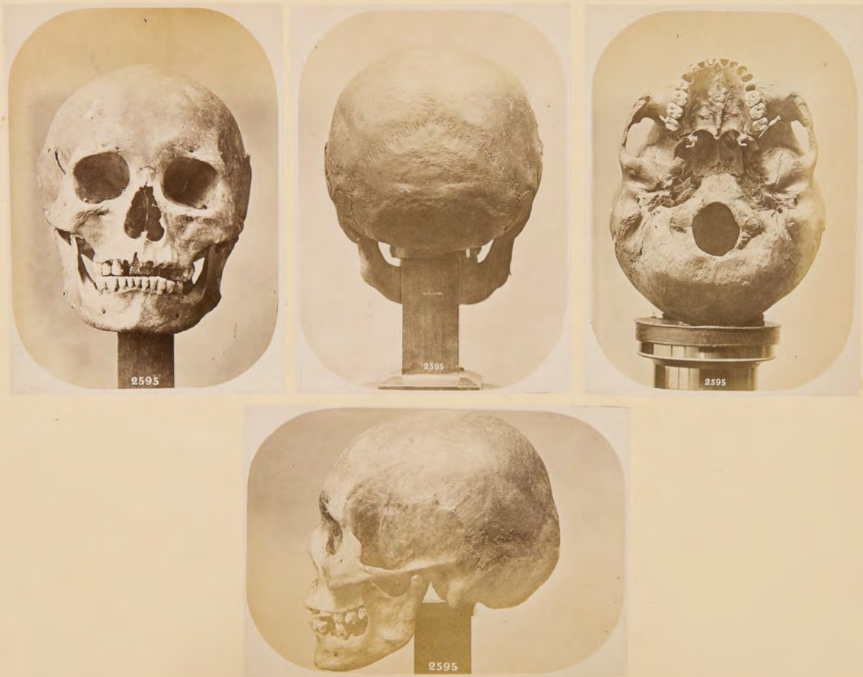
Cranio lappono, di Kautokeino ♂, N. 2595