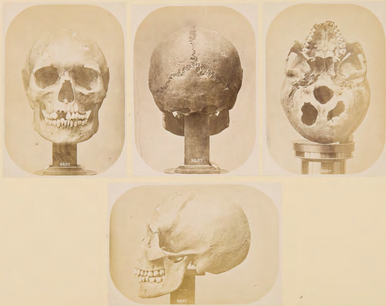
Cranio lappone , di Kautokeino, N. 2607