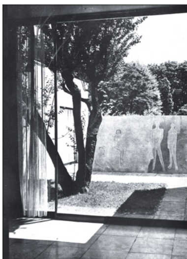
Figure 6 V Triennale di Milano 1933: patio di ingresso nella Villa-studio per un artista di L. Figini e G. Pollini. A.C. nr. 28, Biblioteca Nazionale di Spagna