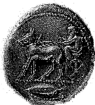
Fig. 3. Tetradrhammer emesso a Reggio (480-476 a.C.) da Anassila con immagine che esalta la vittoria del tiranno ai giochi olimpici nella corsa con biga di mule.