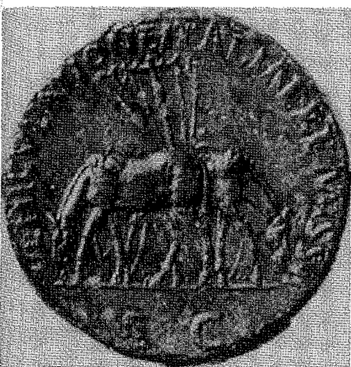
Fig. 1. Muli che pascolano senza collari, briglie e finimenti su un sesterzio con legenda Vehiculatione Italiae remissa , emesso da Nerva nel 97 d.C. per celebrare la dispensa accordata alla penisola dal pagamento del cursus publicus .