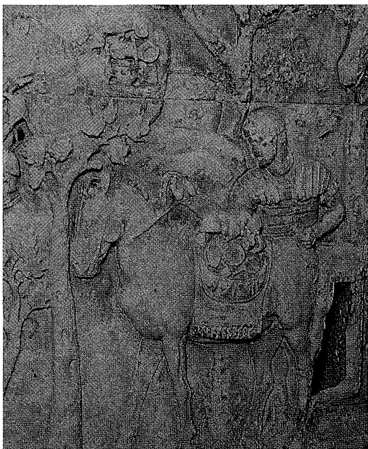
Fig. 5. Colonna Traiana: mulo trasporta il tesoro di Decebalo.