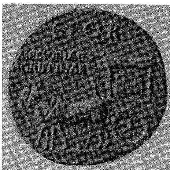
Fig. 2. Carpentum trainato da mule nel rovescio di un sesterzio con legenda SPQR Memoriae Agrippinae .