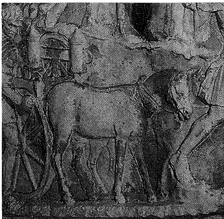
Fig. 4. Colonna Traiana: muli trasportano una catapulta su carro.