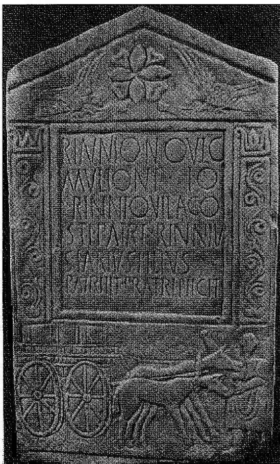
Fig. 7. Stele del mulattiere Rinnius Novicius da Caraglio (prov. Cuneo).