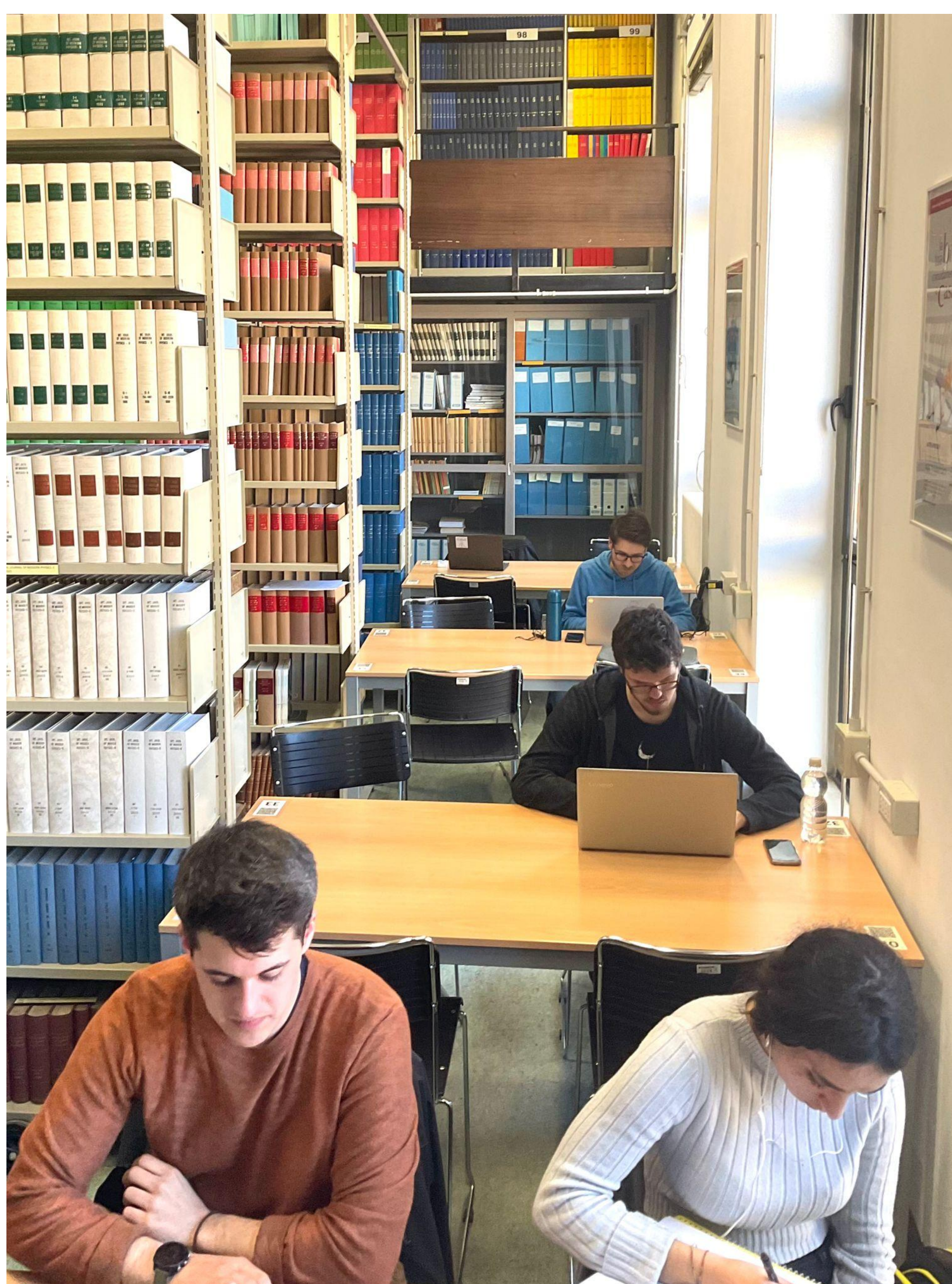
Studenti e studentesse in Sala riviste