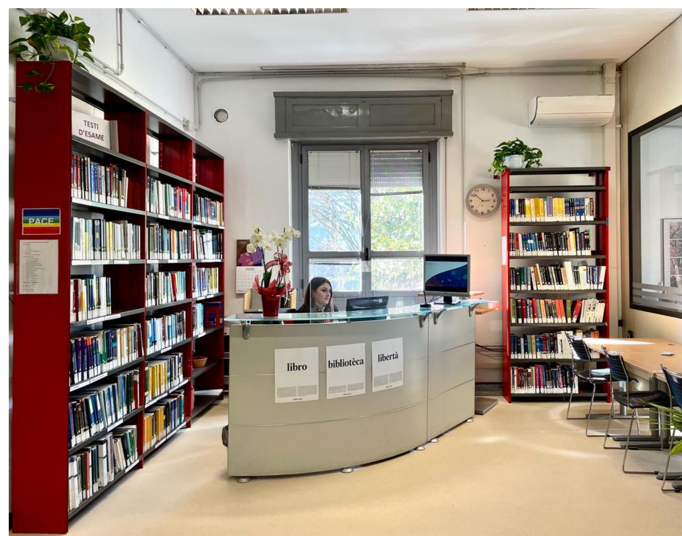
Il Banco accoglienza

Il personale al banco di accoglienza è inoltre a disposizione per fornire un primo orientamento nella selezione e nell'uso delle risorse informative disponibili.