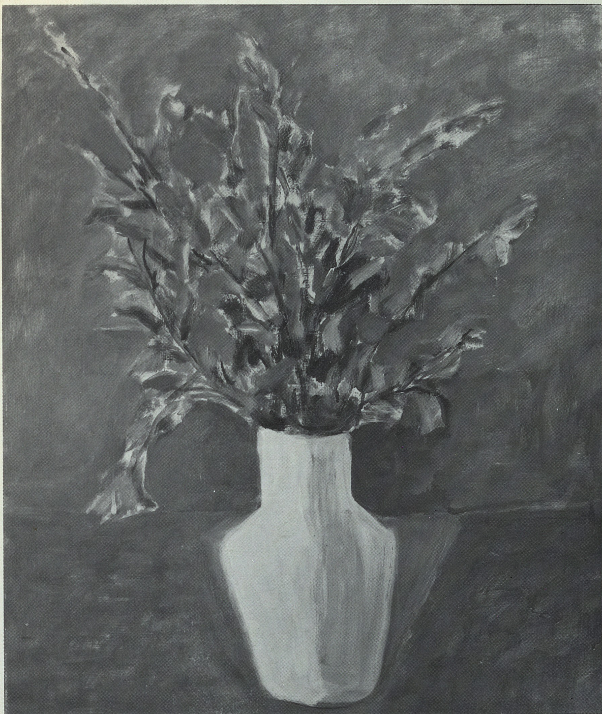
Foglie nel vaso - 1973