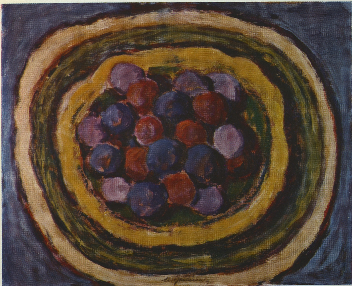
Anemoni al mercato - 1972