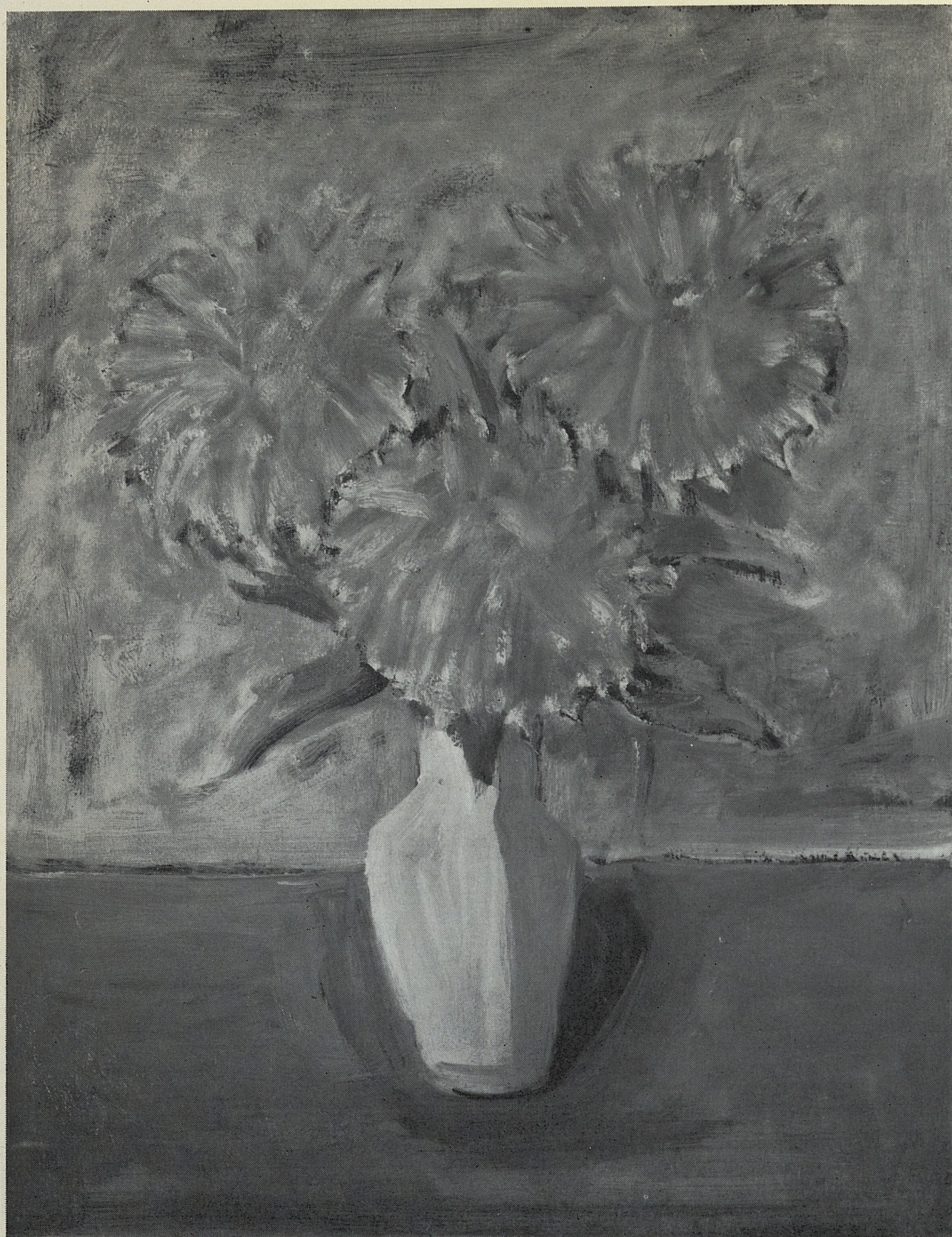
Crisantemi gialli - 1973