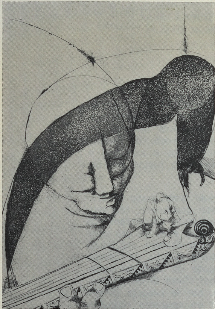
Musica - 1/30 acquaforte acquatinta 1972