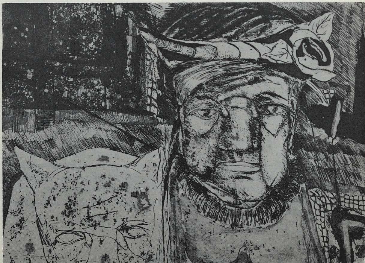
Personaggio e presenza - 1/30 - acquaforte acquatinta 1973