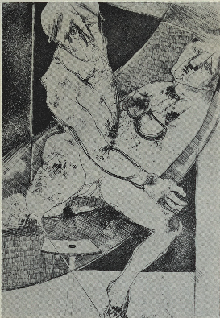
Momento - 1/30 - acquaforte acquatinta 1973