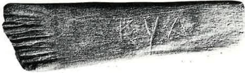
Fig. 2 Oggetto in pietra con iscrizione retica di S.Lorenzo di Sebato. Senza scala.

tratto centrale obliquo. Meno chiaro, quanto a traslitterazione, il secondo segno, simile a quello occorrente nei nr. 1 e 2 (vedi sopra), per cui si è proposto un valore t (foggia t 1 ), abbastanza sicuro nel primo caso, con qualche dubbio nel secondo. In alternativa si può pensare – come già proposto per il nr. 2 – ad una grafia per u , in una forma a tre tratti che però non trova confronti in ambito alfabetico prossimo. Pertanto: